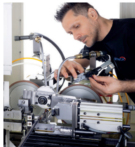
Einrichten einer Rundscheifmaschine