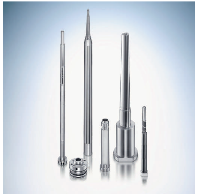
Formkerne, Form- und Abstreifhülsen