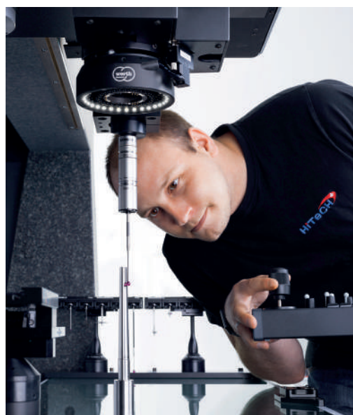
Messmaschine – Messen eines Polygon-Formkerns