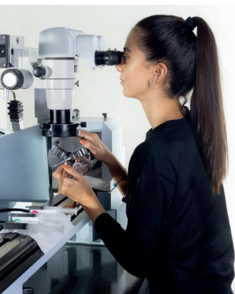
Polierarbeitsplatz – Pipetten-Formkern

nadelähnliche Formkerne sowie Pipettenkerne mit unterschiedlichsten Geometrien und Formkonturen sind seit den Anfängen unsere Spezialität. Gefertigt werden diese passgenau nach Kundenzeichnung und auf Wunsch mit einbaufertiger Politur.